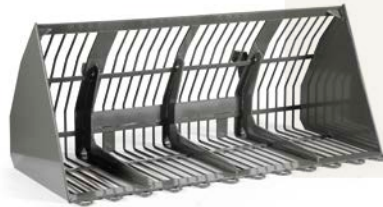
cuchara de remolacha