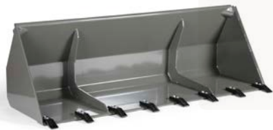
cuchara de áridos