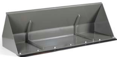
cuchara de limpieza