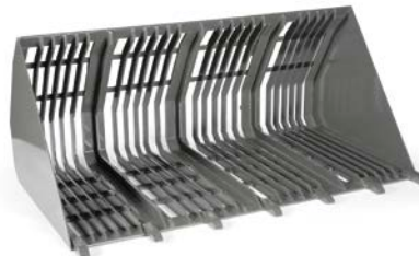
cuchara de piedras